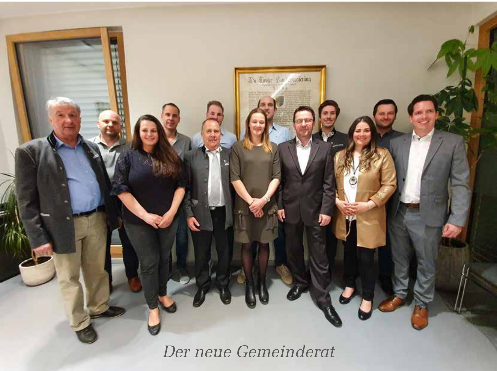
Der neue Gemeinderat