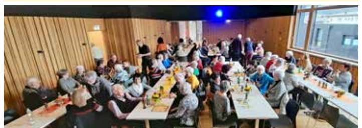
Mitglieder im Saal bei der Jahreshauptversammlung vom 25. 2. 2023